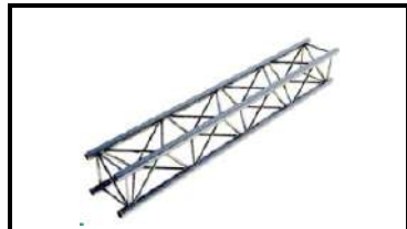
Prolyte/ АТС ферма L-200см