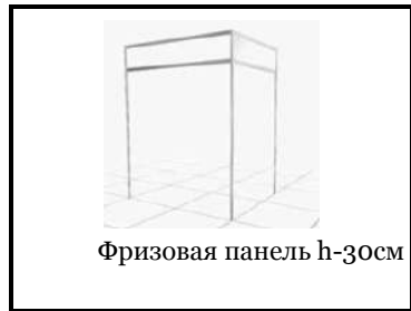
Фризная панель h-30см