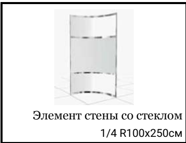
Элемент стены со стеклом 1/4 R100x250см