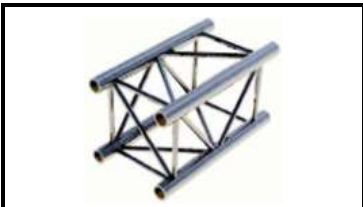
Prolyte/ АТС ферма L-50см