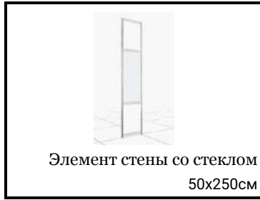
Элемент стены со стеклом 50x250см