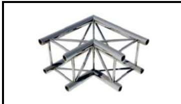
Prolyte/ АТС Г-корнер