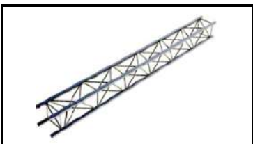
Prolyte/ АТС ферма L-300см