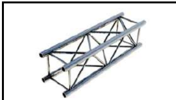
Prolyte/ АТС ферма L-100см