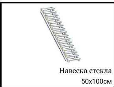
Навеска стекла 50x100см