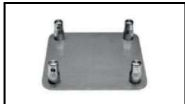
Prolyte/ АТС опора фермы