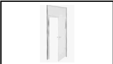
Дверь распашная с замком 100x200см