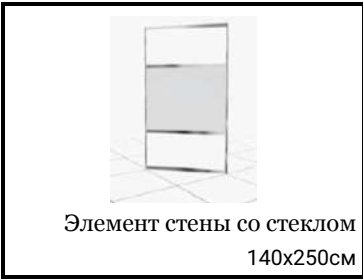
Элемент стены со стеклом 140x250см