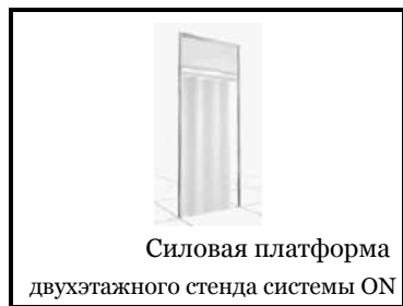
Силовая платформа двухэтажного стенда системы ON