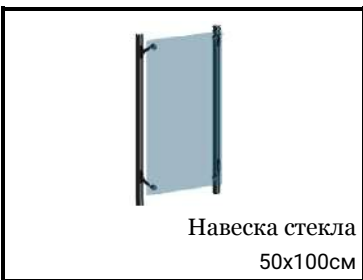
Навеска стекла 50x100см