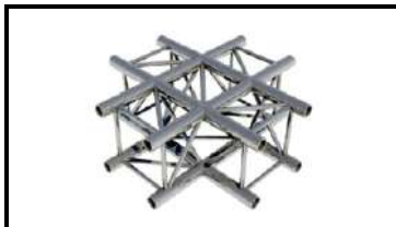
Prolyte/ АТС крест-корнер