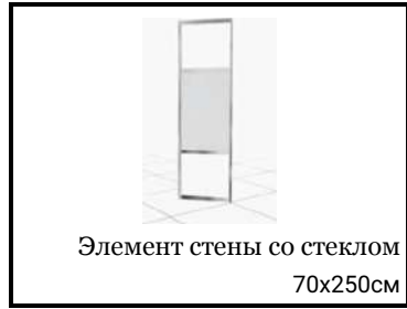
Элемент стены со стеклом 70x250см