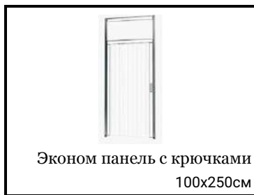
Эконом панель с крючками 100x250см