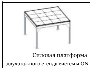
Силовая платформа двухэтажного стенда системы ON