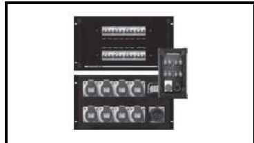
Пульт управления для электрелебедок 8 каналов