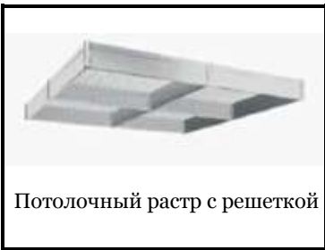
Потолочный растр с решеткой