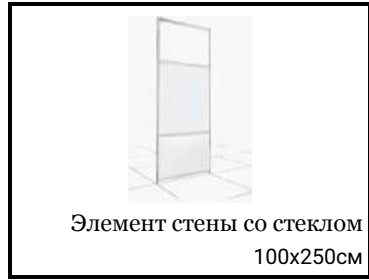
Элемент стены со стеклом 100x250см