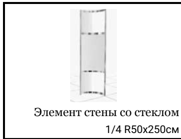
Элемент стены со стеклом 1/4 R50x250см