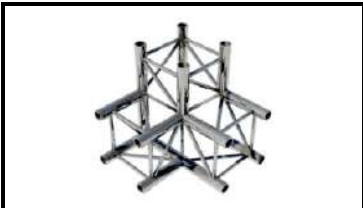
Электрелебедка для подвесов рабочая нагрузка 320кг