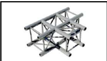
Prolyte/ АТС Т-корнер