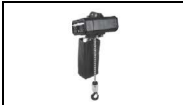
Электрелебедка для подвесов рабочая нагрузка 160кг