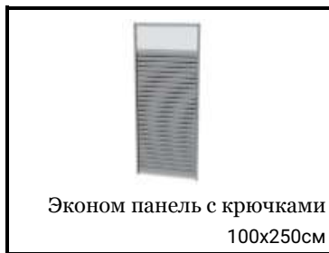
Эконом панель с крючками 100x250см