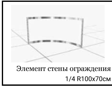
Элемент стены ограждения 1/4 R100x70см